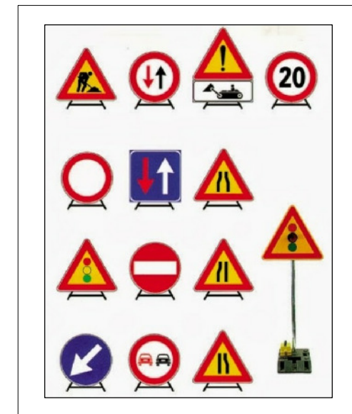
SEGNALETICA DI CANTIERE PER CANTIERE MOBILE (IMMAGINE NON ESAUSTIVA)